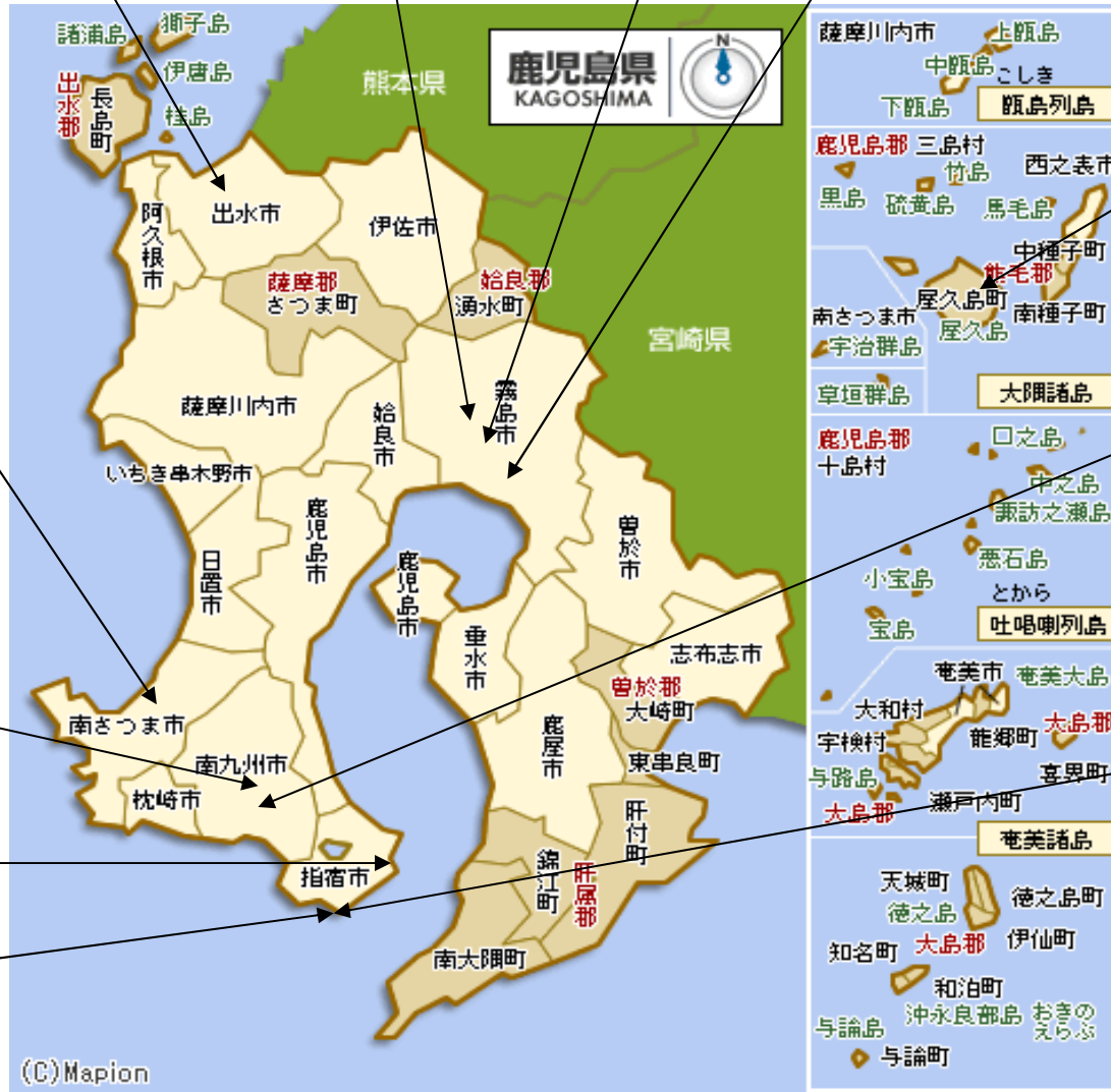
ちらんとっこうきねんかん 知覧特攻記念館