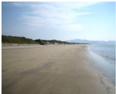
ふきあげはま 吹上浜