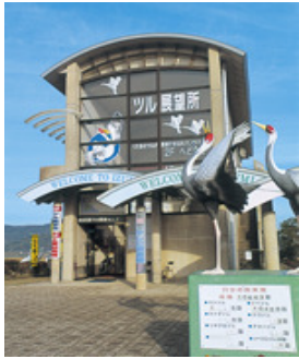
いずみしづるかんこう 出水市鶴観光 センター